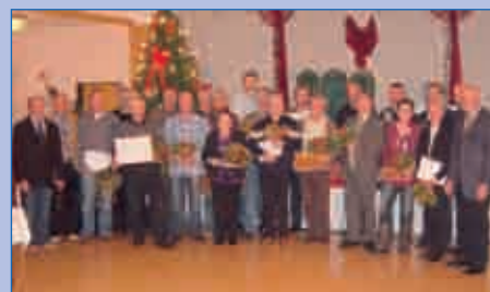
Unser Bild zeigt die Jubilare mitsamt der Redenius-Geschäftsleitung.

Beide NOWEBAU -Standorte Redenius sind seit mehreren Jahrzehnten erfolgreich am Markt tätig und gelten in der Region als einer der größten Arbeitgeber.