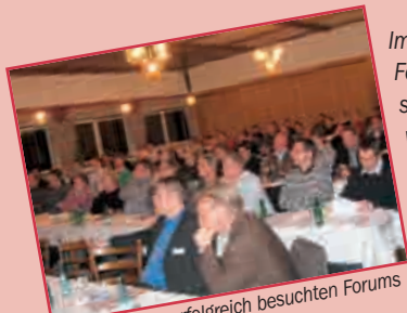
Überblick des erfolgreich besuchten Forums in Haselünne

Im Rahmen eines Experten-Forums des NOWEBAU -Gesellschafters Vehmeyer aus Haselünne wurden über 70 ortsansässigen Architekten, Bauingenieuren und Bauunternehmen aus dem Emsland die aktuellen Veränderungen in der Energie-Einsparverordnung 2009 vorgestellt.